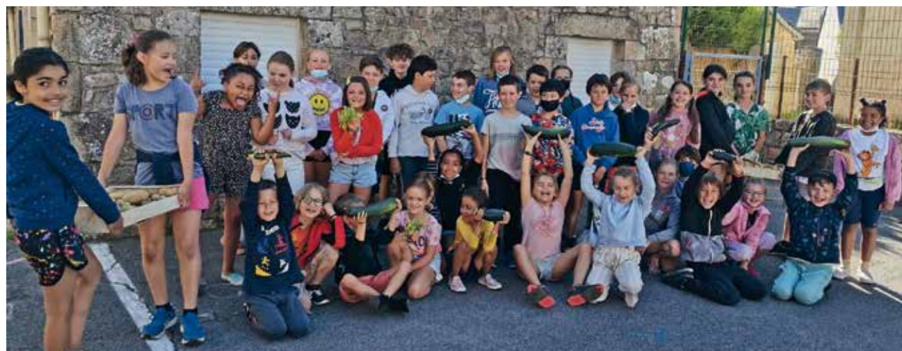
Les récoltes du jardin potager.