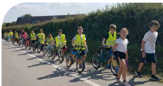
EPS: course d'orientation à vélo.