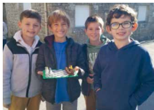
Jeux de construction à la récréation.