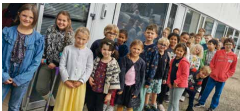
Rencontre avec l'atelier Mémoire pendant la semaine bleue autour de la vie d'avant.