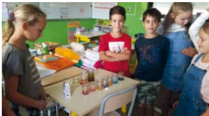
Expérience sur la miscibilité des liquides.