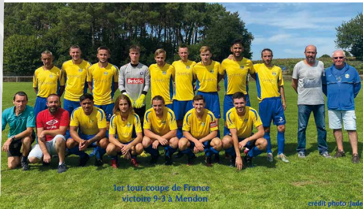
1er tour coupe de France victoire 9-3 à Mendon