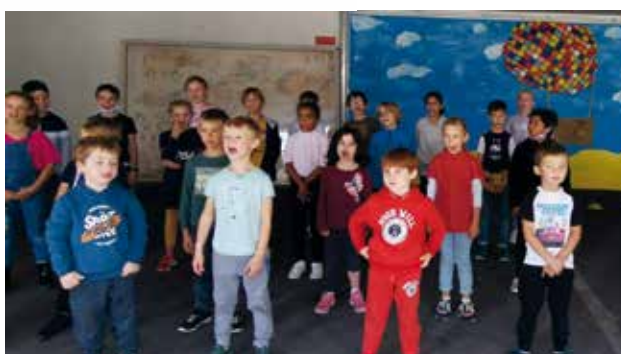
Les débuts de la chorale.