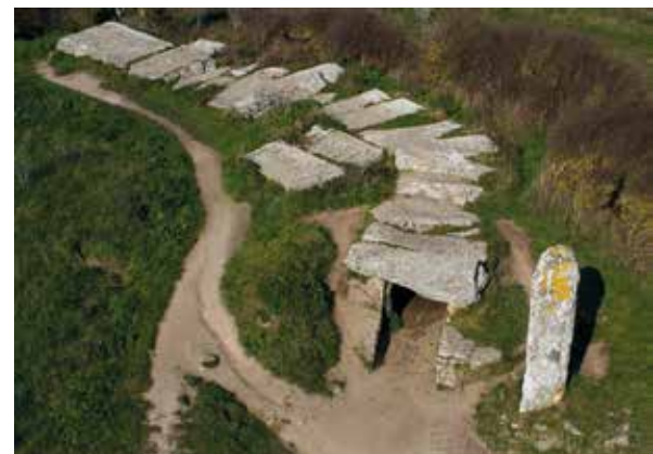
• Les Pierre-Plates