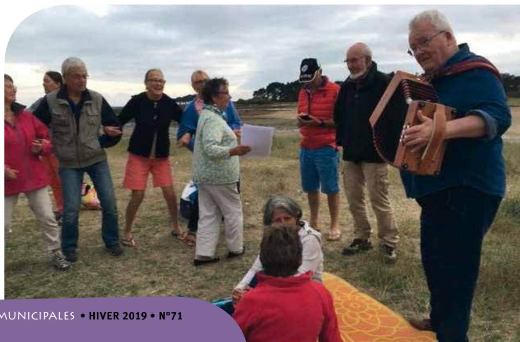
• 28 Août 2019 - GRAIn D'PICNIC au Toul Keun

J. DOULIN - Tél. 02 97 57 45 20 Janrene.doulin@orange.fr