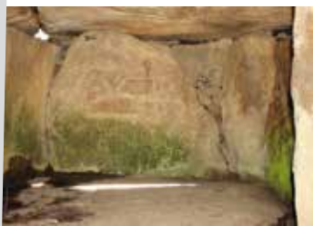
• Mane Lud