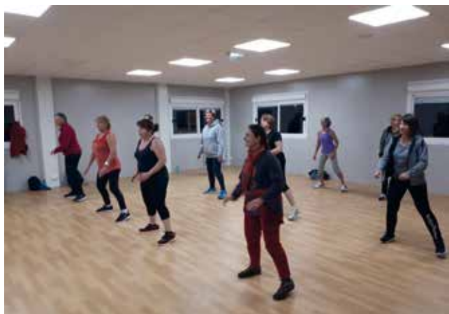
• Un cours de gymnastique adulte