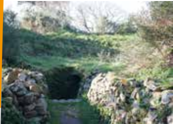
• Mane Er Hroech