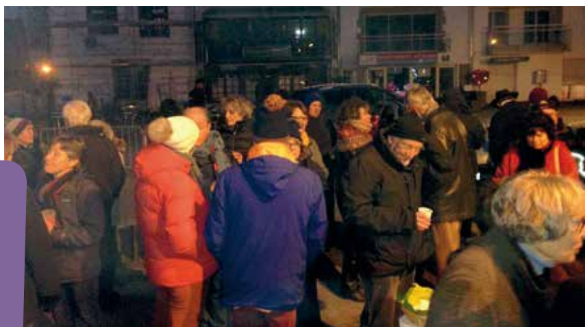
• 1 o Janvier 2019 - GRAIn D'LUMIERE sur le port