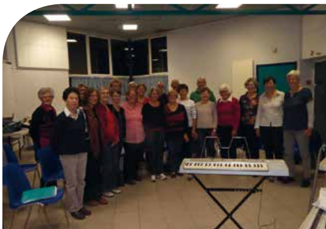
• La chorale