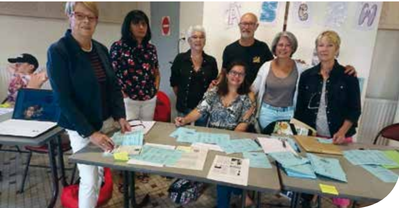
• Au forum des associations le 07 septembre

Notre association, forte de ses cent soixante-cinq adhérents, est toujours dynamique dans toutes les activités.