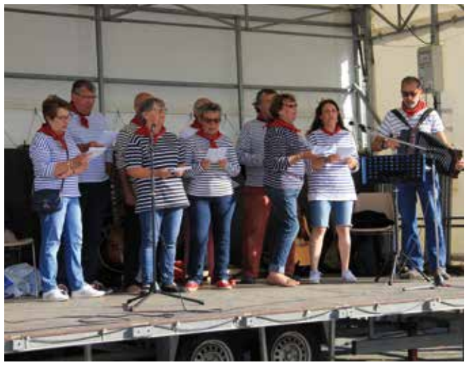
• Le groupe de Kaer e Mem bro