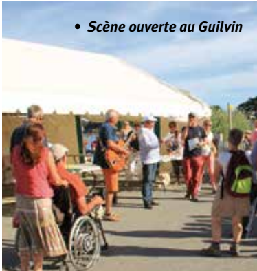
• Scène ouverte au Guilvin