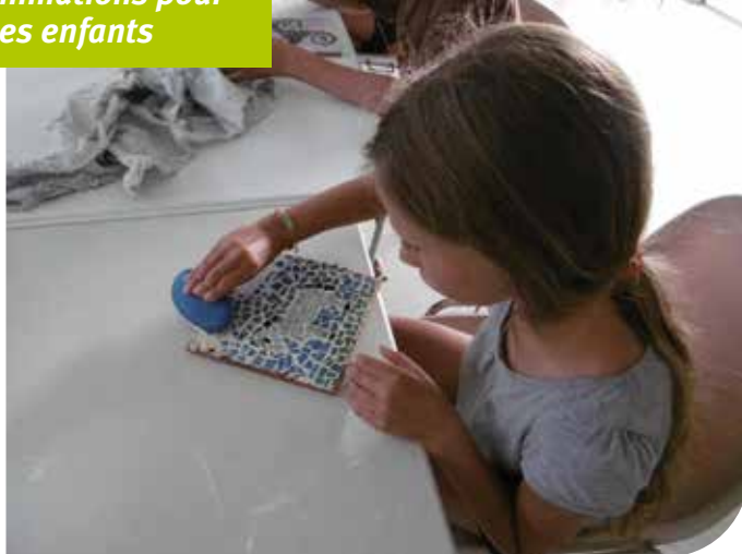
• Partir en Livre sur la plage du Toul Keun