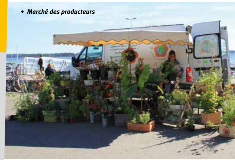
• Marché des producteurs