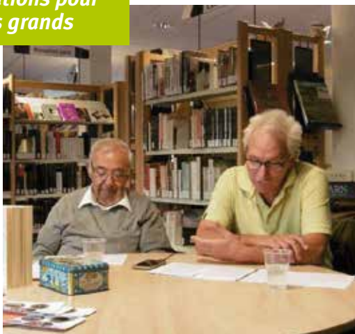
• Un Automne Autrement 2018 : Lecture à haute voix par Ti Douar Alré.