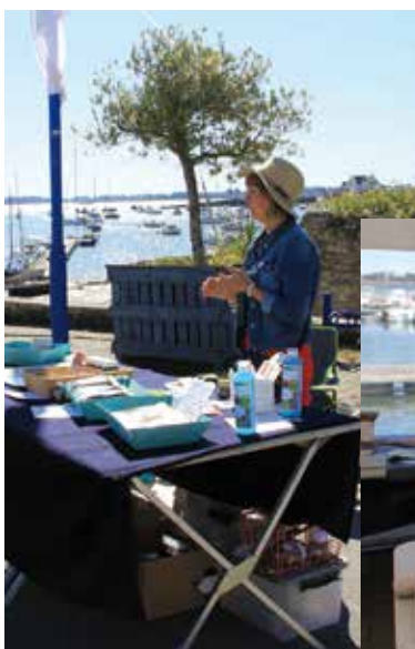
• Le marché