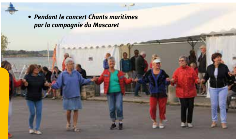
• Pendant le concert Chants maritimes par la compagnie du Mascaret