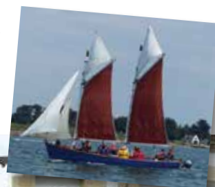
• Loup de mer au Logeo