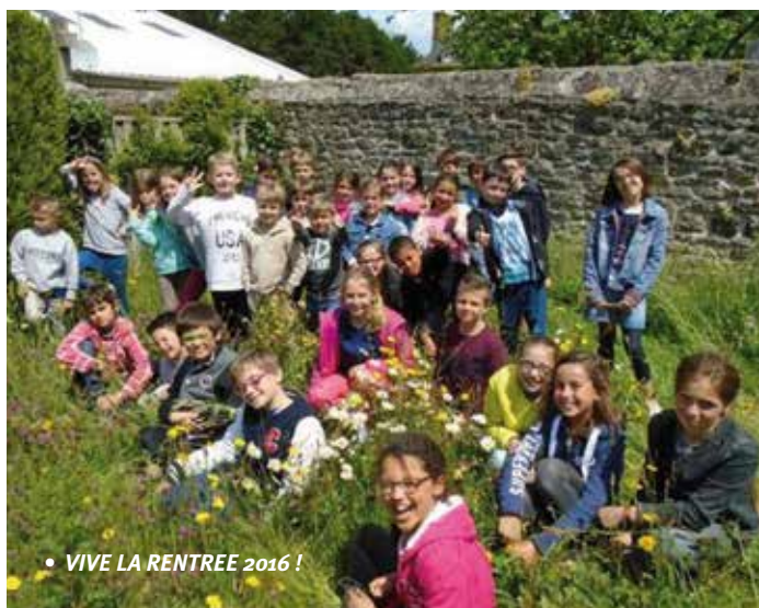
• VIVE LA RENTREE 2016 !