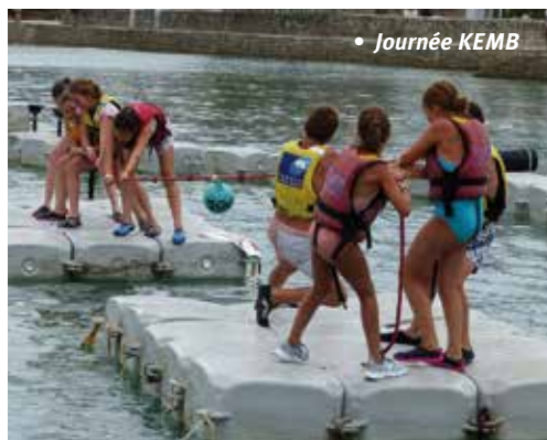
• Journée KEMB