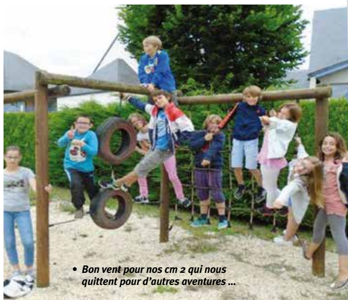
• Bon vent pour nos cm 2 qui nous quittent pour d'autres aventures ...