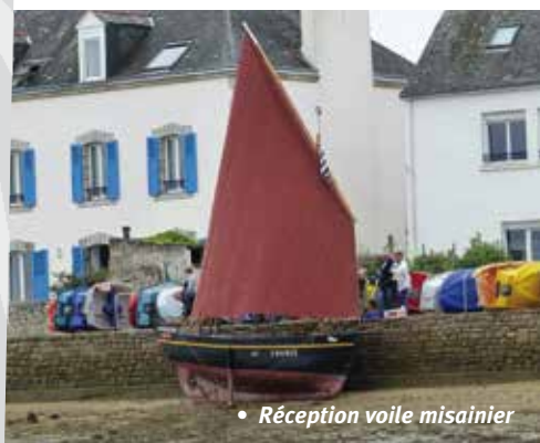
• Réception voile misainier

Plus de détails sur notre association dans son site www.kaeremembro.asso.fr qui a été entièrement rebâti en 2016.