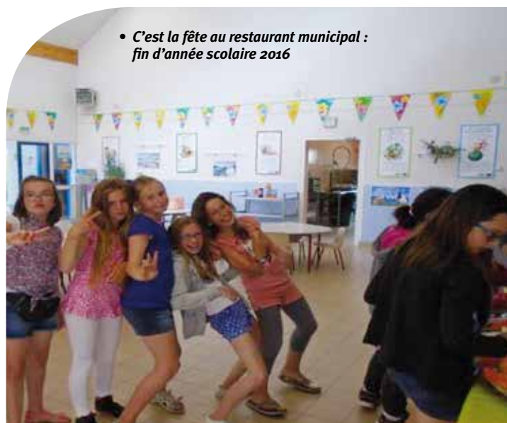
• C'est la fête au restaurant municipal : fin d'année scolaire 2016