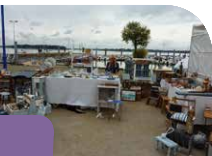
• Troc pêche et puces de mer