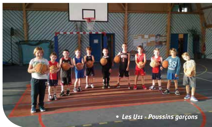
• Les U11 - Poussins garçons

Six graines de champions se sont inscrites cette saison. Ils ne participeront pas, pour le moment, au championnat départemental, au moins durant la première phase.