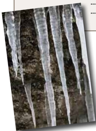
Dent Genver : Pimpilhoù / pitennoù kler

* Meur a stumm ag ar lavar-se a gaver àr zouar Alre : Gurun en Azvent ... a daol ar gouiañv àr e benn. ... a daol ar gouiañv àr e zent. ... a daol ar gouiañv a bep eilpenn. ... a gas ar gouiañv en e hent.