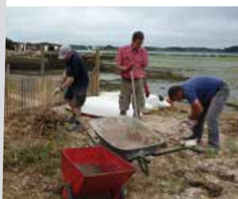
• Port Fétan

L'association Kaër é Mem Bro a pour objectif d'animer, promouvoir et développer le patrimoine maritime de Locmariaquer et également d'être le lieu de rencontres et d'échanges des usagers et des amis du port.